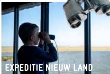
EXPEDITIE NIEUW LAND

EXPEDITIE NIEUW LAND | NATUURBELEVINGSCENTRUM DE OOSTVAARDERS GROEP 6-8 | PRIJS €3,50 PER LEERLING