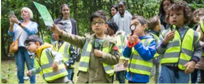
Leerlingen basisonderwijs, groep 1 t/m 8

De educatieactiviteiten sluiten aan bij de kerndoelen van het onderwijs en passen bij het curriculum. Zoals afgesproken in de prestatieafspraken met de gemeenten willen we meer kinderen en jongeren bereiken met ons educatieaanbod. Dit hebben we vertaald in onderstaande ambities.