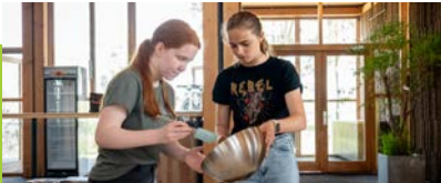
Leerlingen voortgezet onderwijs

Alle kinderen uit Almere nemen tenminste 2 x in hun basisschoolperiode (1x onderbouw en 1 x bovenbouw) deel aan één van onze educatieve activiteiten. Van 20.000 kinderen in 2020 naar 25.000 in 2025.