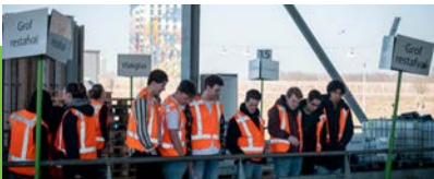
Studenten middelbaar en hoger beroepsonderwijs

Groeien naar jaarlijks minimaal 6000 leerlingen die deelnemen aan een van onze educatieprogramma's voor VO.